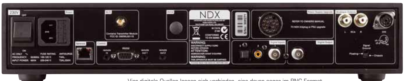
Vier digitale Quellen lassen sich verbinden, eine davon sogar im BNC-Format

Und das lohnt sich, denn der NDX zeigt ohne Umwege, welches Potenzial in Netzwerkmusik steckt. Die stabile Abbildung und tonale Perfektion sorgt sofort für ein Klangbild, das eine aufhorchen lässt. Und noch was kommt dazu: Der NDX ist kein Kostverächter, der schwarz Briten musiziert vorzugsweise dynamisch, energiereich und hat