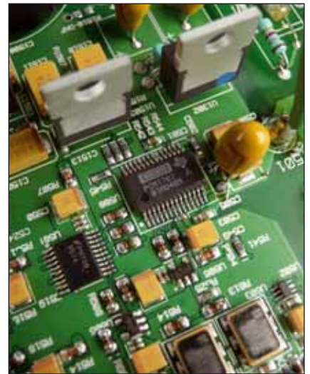
Gewandelt wird von einem Burr-Brown-DAC vom Typ 1791 – eine gute Wahl

Und das lohnt sich, denn der NDX zeigt ohne Umwege, welches Potenzial in Netzwerkmusik steckt. Die stabile Abbildung und tonale Perfektion sorgt sofort für ein Klangbild, das eine aufhorchen lässt. Und noch was kommt dazu: Der NDX ist kein Kostverächter, der schwarz Briten musiziert vorzugsweise dynamisch, energiereich und hat