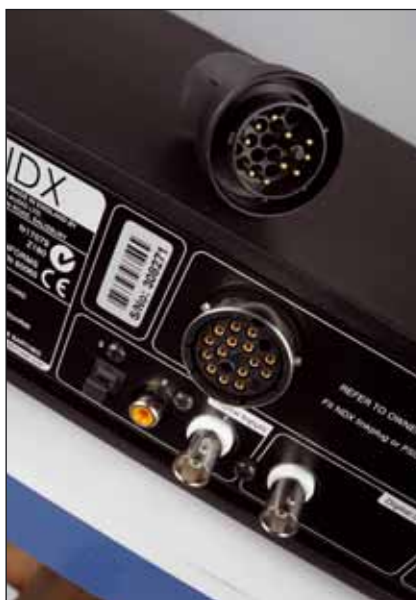
Das Naim-typische Netzteilung ist natürlich auch dabei

braucht. Gut, man kann natürlich die Bedienung mit einem als Funkfernbedienung zweckentfremdeten Telefon oder Tablet-PC vornehmen. Ehrlich gesagt verzichte ich dann auch gern auf ein buntes Touchpanel vornedran, wenn man am Gerät selbst auf eine stabile, nie festhängende und nicht auf Bugfixes angewiesene Nutzeroberfläche bauen kann. Übrigens: Auf „normalen“ Tablet-PCs nutzt man problemlos die Streaming-Funktion des NDX, am besten funktioniert jedoch die kostenpflichtige iPod-Software, mit