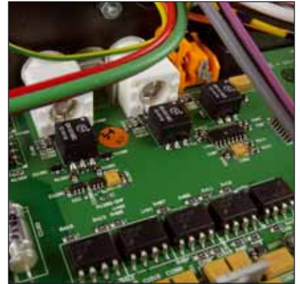
Alle Eingänge sind galvanisch entkoppelt – das macht man so, wenn's richtig werden soll